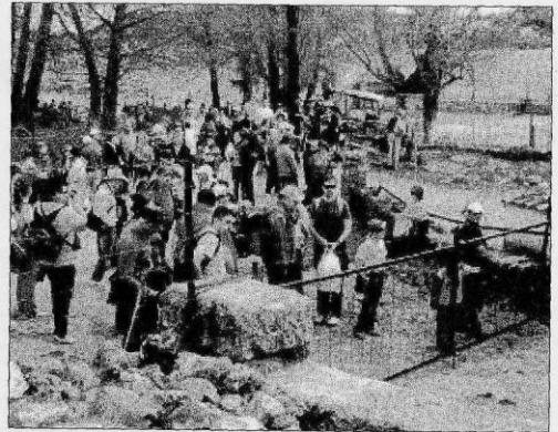
Llegada a una de las puertas.

También cuentan que está ocurriendo lo mismo en otros lugares. “Parece que en lugar de ir a menos está apareciendo en otros puntos de la provincia”, se lamentan.