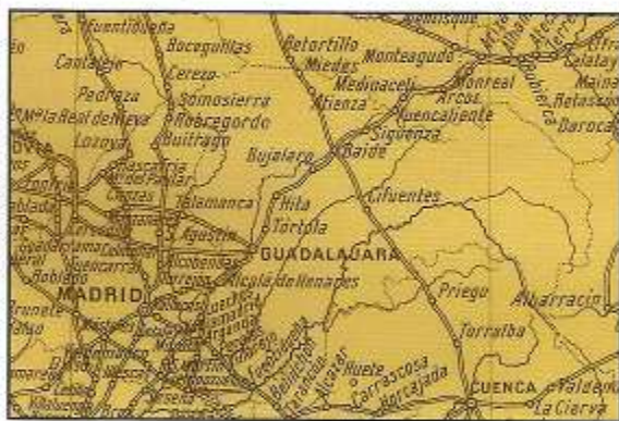
▲ Parte del mapa que realizó Gonzalo Menéndez Pidal en 1951 a partir del mapa del Repertorio de Caminos de Villuga.

Tres caminos Toledo-Zaragoza, Toledo-Cuenca y Cuenca-Burgos tienen especial importancia para nosotros. En el caso del primero es ob-