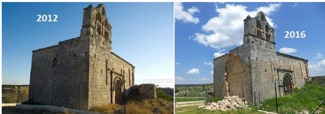
IGLESIA ROMÁNICA DE VILLAESCUSA DE PALOSITOS (GUADALAJARA) DECLARADA BIEN DE INTERÉS CULTURAL EN JUNIO DEL AÑO 2012