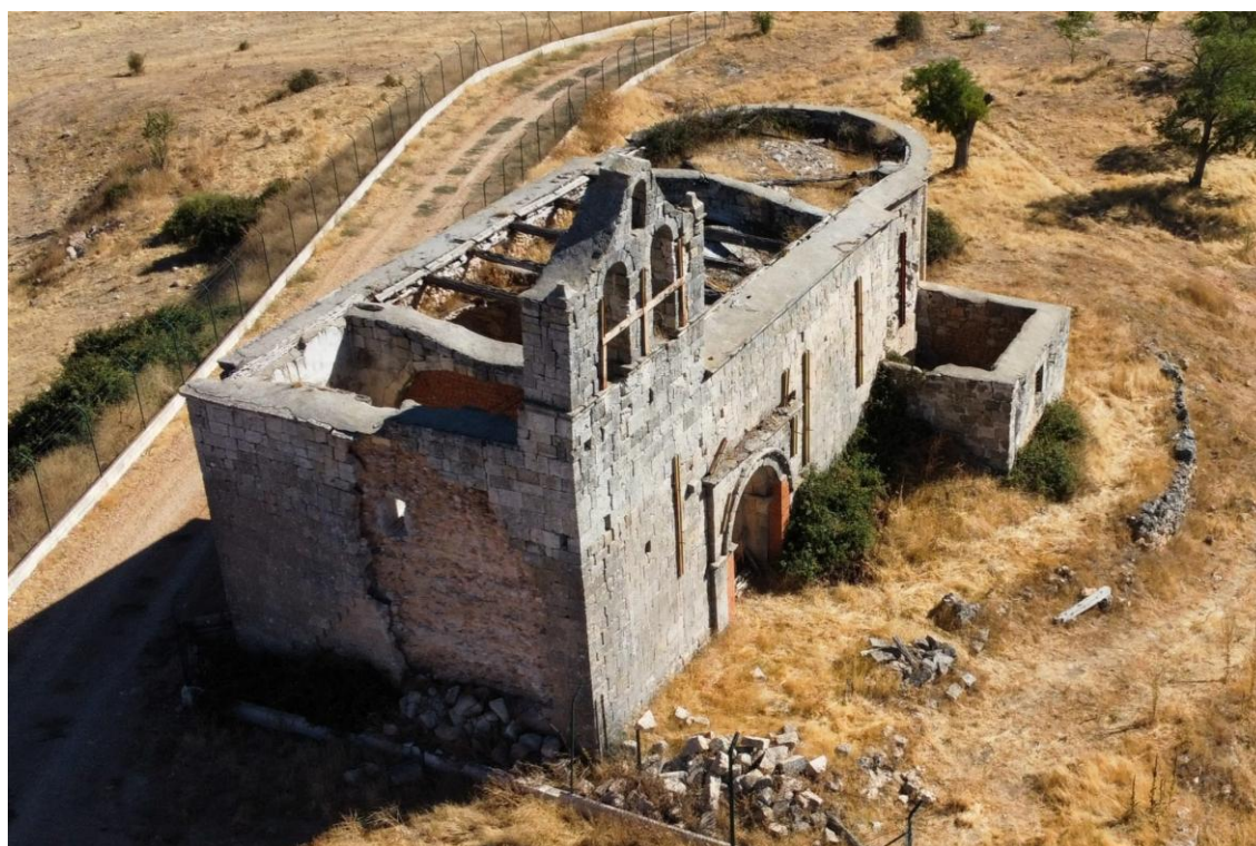
SITUACIÓN EN 2023