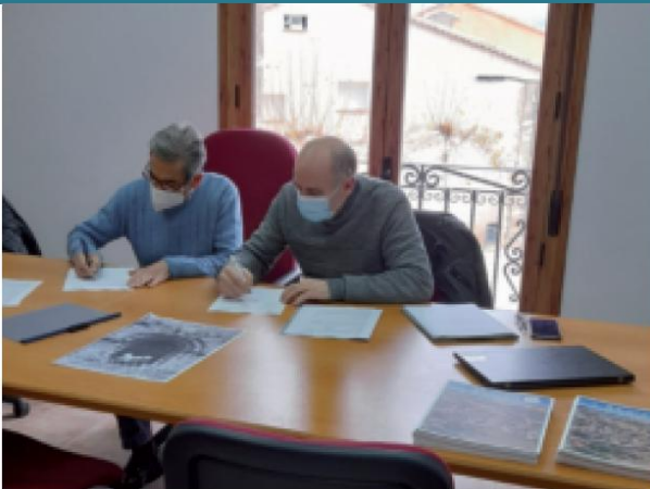
Cesión del Archivo e inauguración de la Exposición. 2021

El acto de cesión se formalizó en diciembre de 2021, y más de una treintena de piezas de gran tamaño cedidas por la asociación Amigos de Villaescusa de Palositos conforman desde entonces esta exposición permanente bajo el cuidado y conservación del Ayuntamiento de Peralveche.