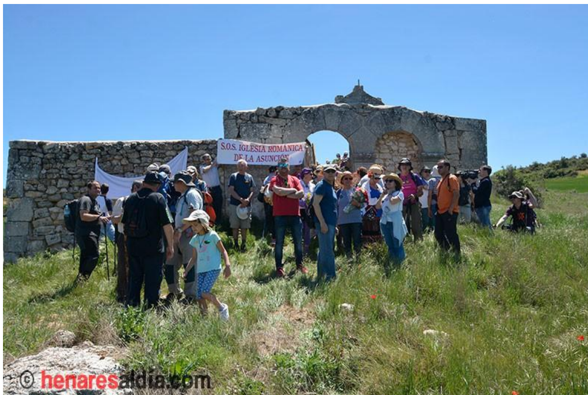
XII Marcha de las Flores:- Villaescusa de Palositos