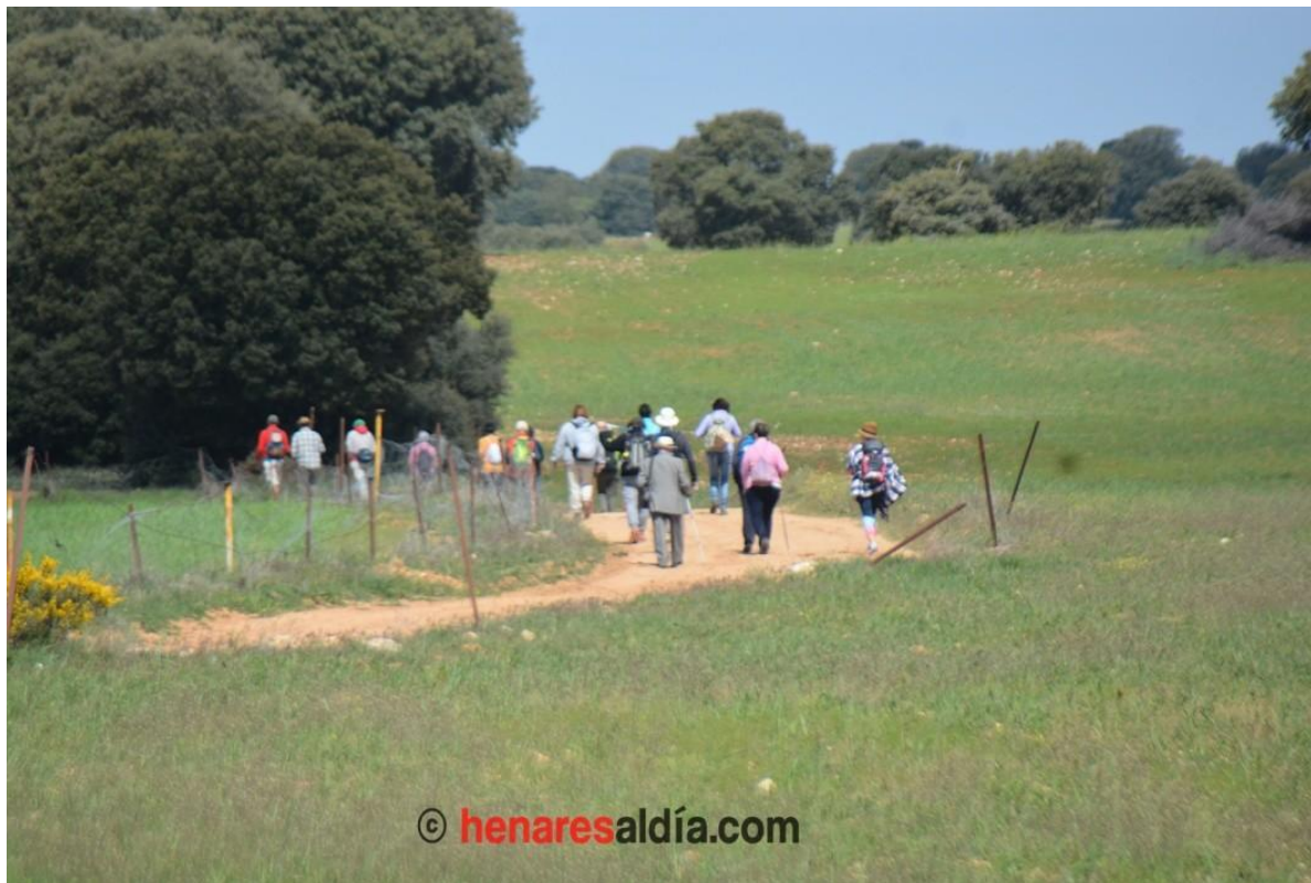
XIII Marcha de la Flores.- Villaescusa de Palositos

Este evento, que cumple 15 ediciones, tiene un claro fin reivindicativo. “Pretende reclamar una solución urgente a un problema sencillo de resolver y que se está dilatando – incomprensiblemente– en el tiempo. Se trata de recuperar unos bienes que son de todos y de asegurar el derecho de cualquier persona a transitar por los caminos públicos”, subrayan sus impulsores. “El aislamiento del sitio y los cortes ilegales de caminos y vías pecuarias han favorecido la destrucción de un patrimonio irrecuperable, borrando el trazado medieval del poblado”. De hecho, “aún hoy, dichas circunstancias ponen en peligro la conservación de su valiosa iglesia e impiden el libre tránsito de ciudadanos y peregrinos, sin que las administraciones actúen con la rapidez necesaria para restablecer la legalidad”.