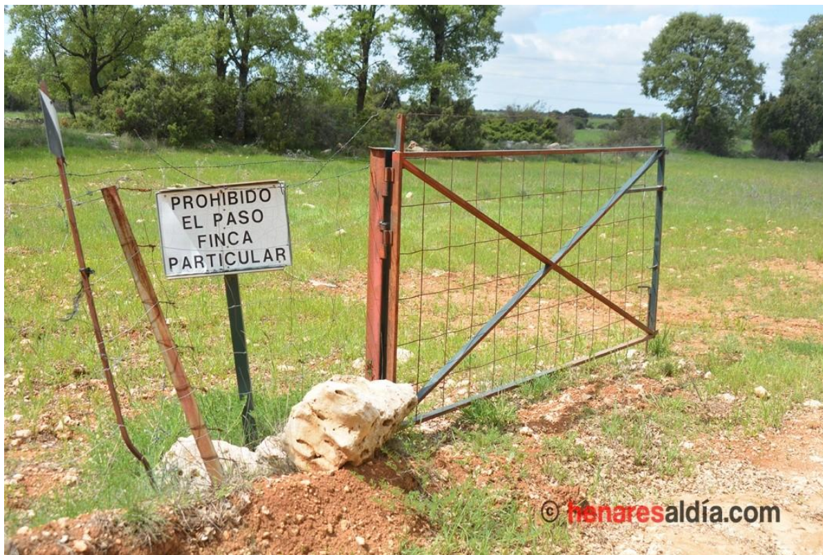
XIII Marcha de la Flores.- Villaescusa de Palositos