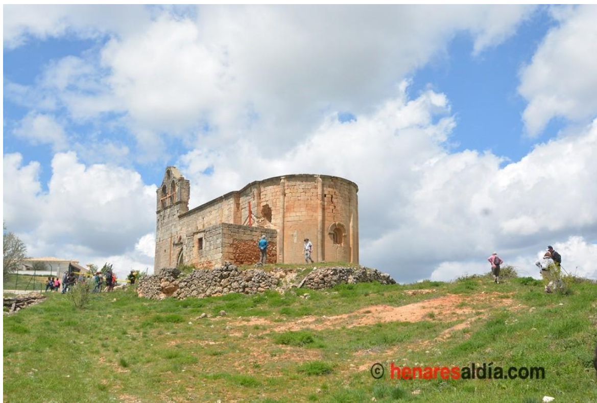
XIII Marcha de la Flores.- Villaescusa de Palositos

Villaescusa se encuentra deshabitada desde la década de 1970, debido al éxodo rural. Llegó a ser un municipio independiente, pero las edificaciones que quedaron en pie se acabaron incorporando –en lo político– a Peralveche. Además, y con el discurrir del tiempo, los terrenos de la antigua localidad cayeron en manos privadas, traspasándose entre diferentes propietarios a lo largo de los últimos años.