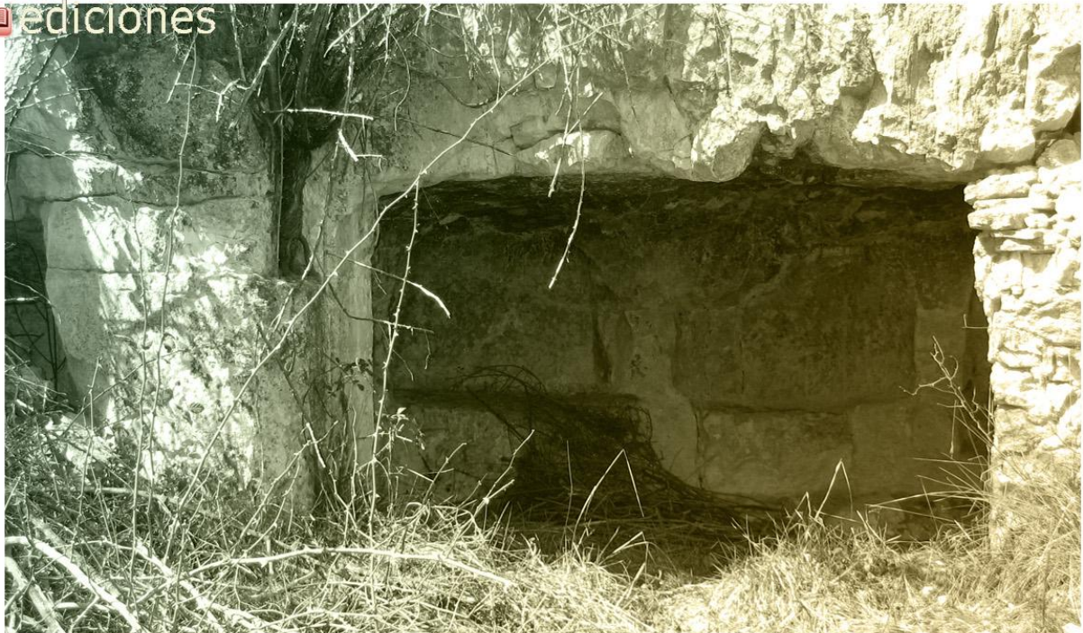
Villaescusa de Palositos. La covacha de San Bartolomé.