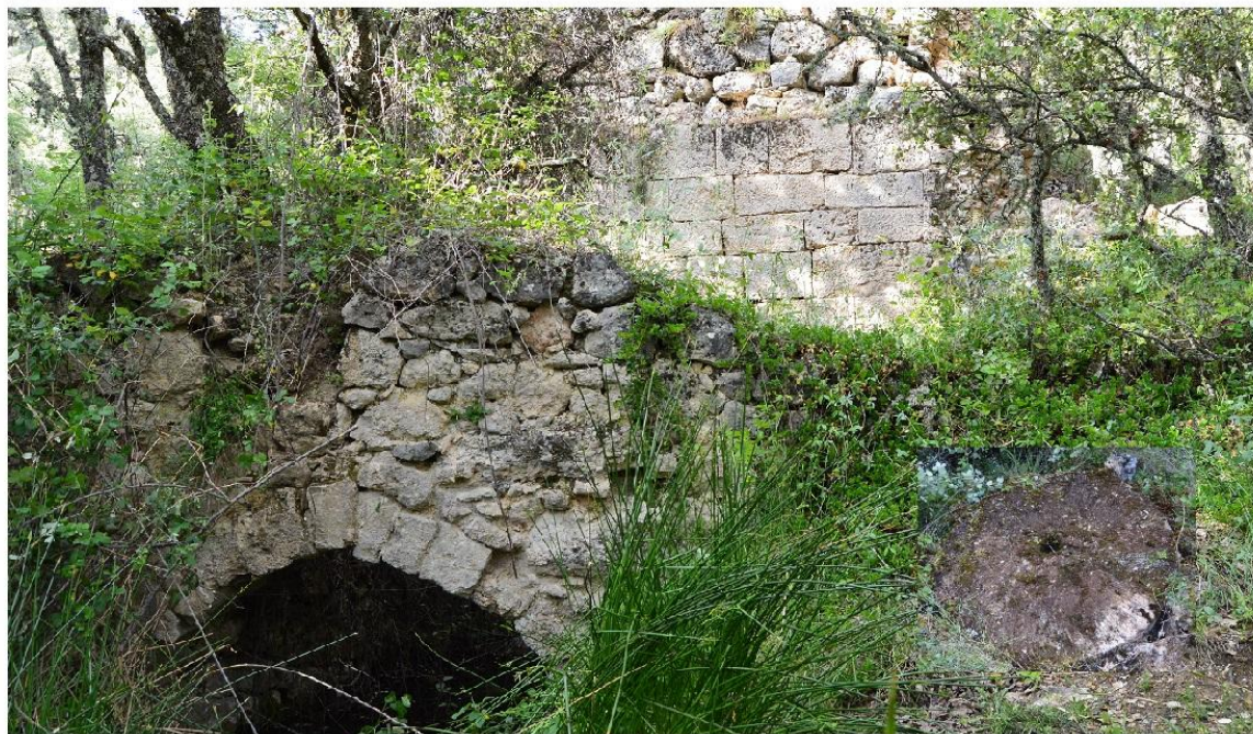
Villaescusa de Palositos. El Molino Montera.