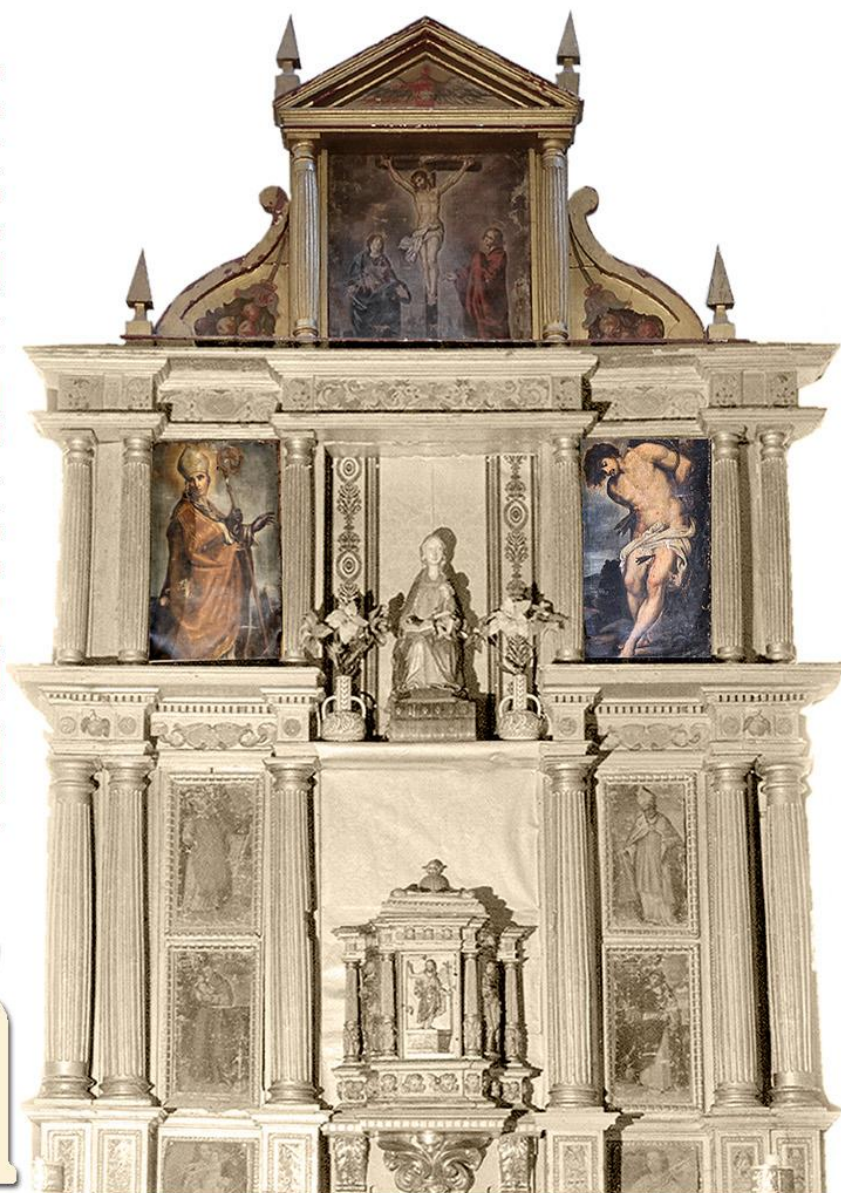
Retablo mayor de Villaescusa de Palositos (hoy en Romancos)

PATRIMONIO DE GUADALAJARA VILLAESCUSA DE PALOSITOS