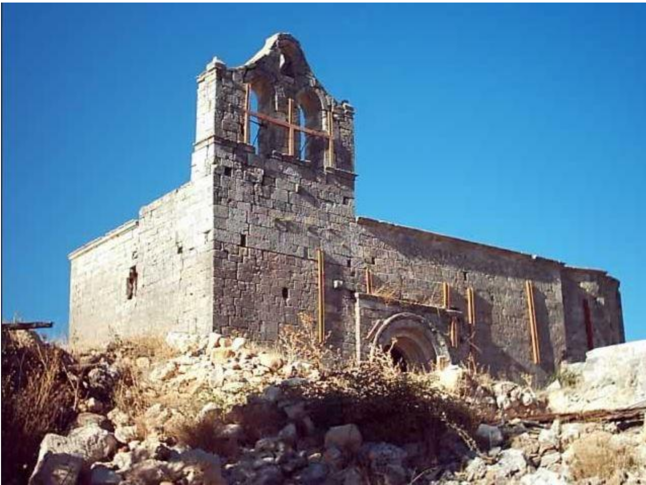
Iglesia de la Asunción de Villaescusa de Palositos.