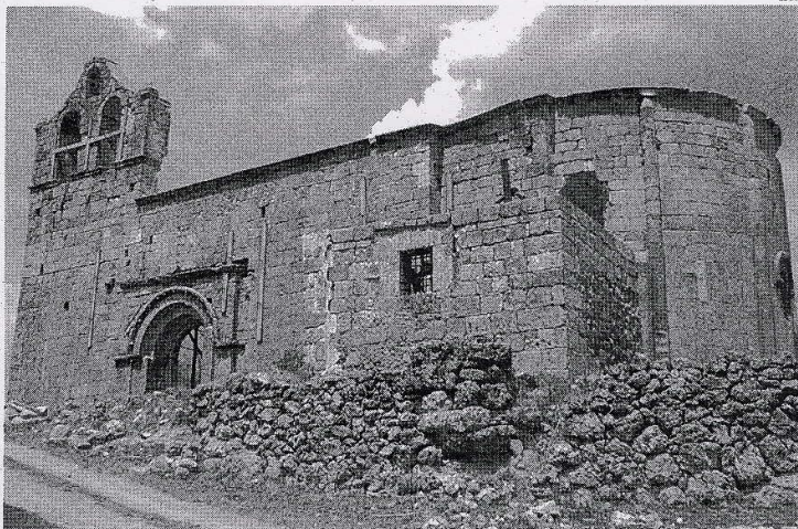
Iglesia de Villae-cusa