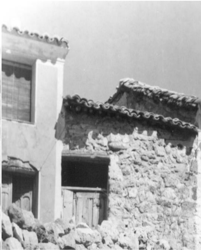
Pósito de Villaescusa de Palositos adosado a la casa-escuela. (Imagen de la década de 1960)